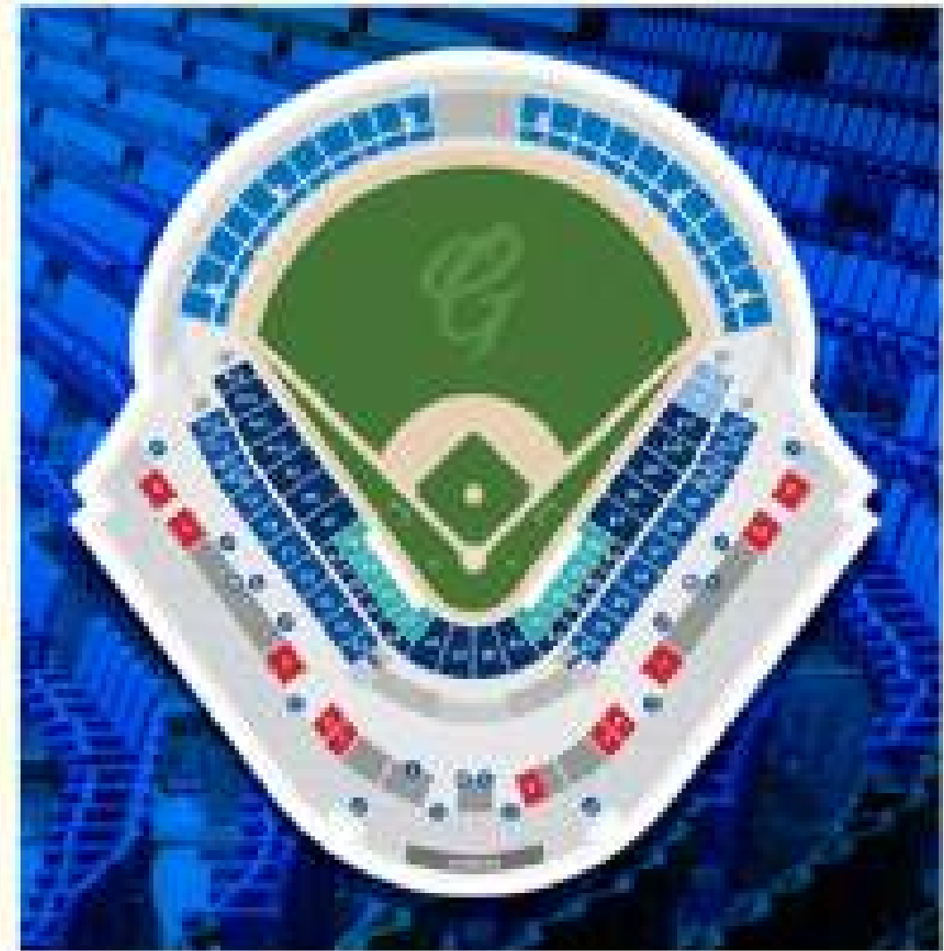
進場前的場地可以加以利用